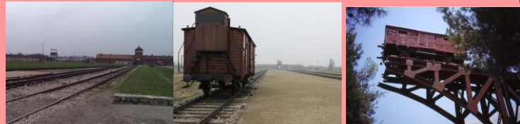
Photographies personnelles de la Bahnrampe

La très forte mortalité dans le camp explique la pratique du tatouage du numéro d'enregistrement, inaugurée sur la poitrine des prisonniers de guerre soviétiques en septembre 1941 et généralisée à partir de février 1943 sur l'avant-bras gauche de tous les détenus immatriculés, juifs ou non. Ce tatouage est une autre des particularités d'Auschwitz. Dans les autres camps, les déportés avaient leur numéro de matricule cousu sur le vêtement au niveau de la poitrine. C'est au début de l'année 1943 que le commandant d'Auschwitz, Rudolf Höss, décida de faire tatouer tous les détenus, hommes et femmes, à l'exception des seuls Allemands.