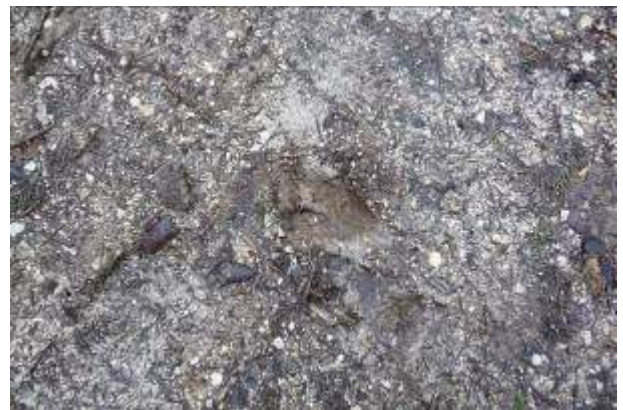
Empreinte de cerf