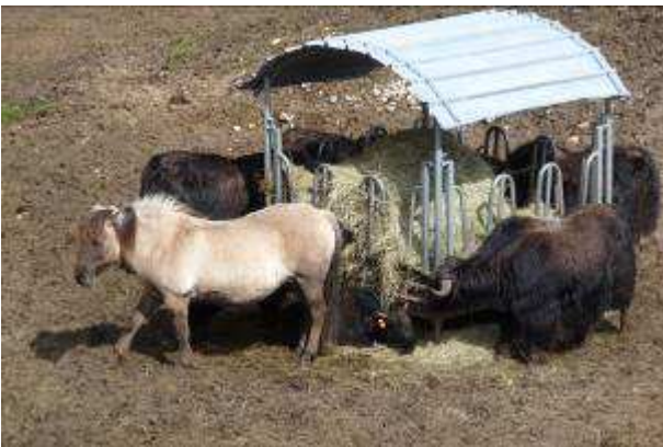
Cheval Konik polski et yaks