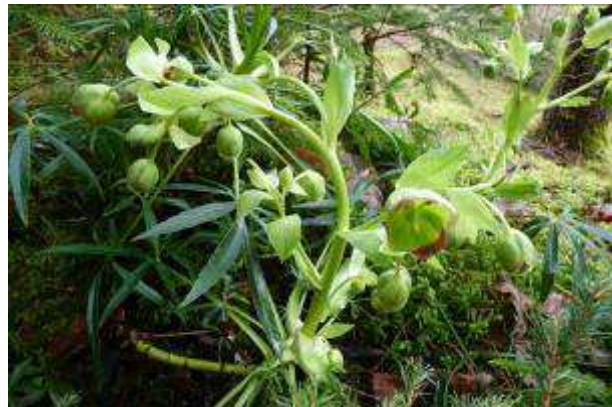
Hellébore fétide (Helleborus Foetidus)