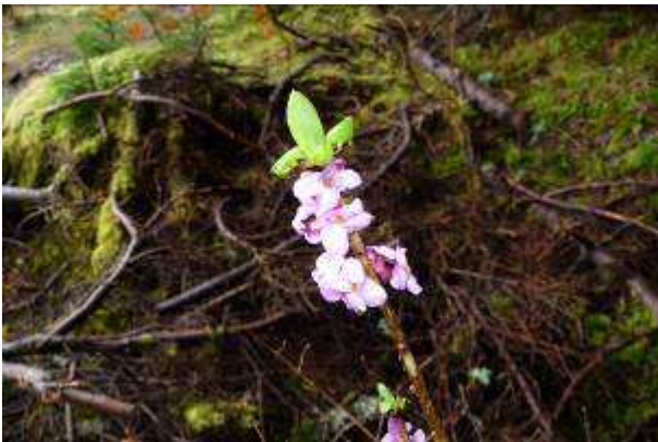
Bois joli (Daphne Mezereum)