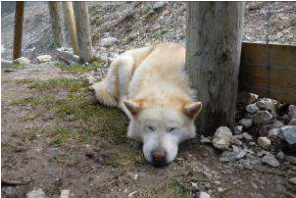
Chien du Groenland

Visite du Parc Polaire à Chaux Neuve. Il est situé à 1200 M dans une ancienne ferme d'alpage.