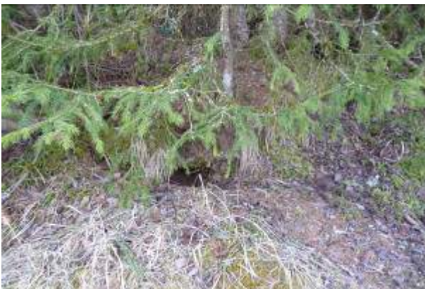
Terrier du blaireau

Le givre recouvre les arbres et les champs. Deux chevreuils broutent dans le pré, ils nous entendent et nous voient mais ne bougent pas car nous sommes loin.